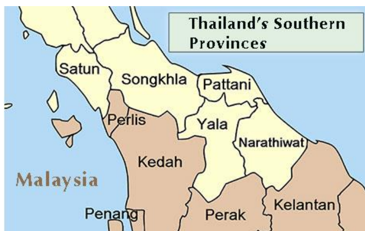
ภาพที่ ๑ จังหวัดในประเทศไทยที่มีพรมแดนทางบกติดกับประเทศมาเลเซียจำนวน ๕ จังหวัด

ประเทศไทยมีจังหวัดที่มีพรมแดนทางบกติดกับประเทศมาเลเซียจำนวน ๕ จังหวัด คือ สตูล สงขลา ยะลา และนราธิวาส ซึ่งแต่ละจังหวัดมีด่านศุลกากรที่เป็นจุดเชื่อมต่อการค้าข้ามพรมแดนของสินค้า ทั้งทางบก ทางน้ำ และทางรถไฟ ดังนี้ ด่านศุลกากรวังประจัน จังหวัดสตูล ด่านศุลกากรบ้านประกอบ ด่านศุลกากรสะเดา และด่านศุลกากรปาดังเบซาร์ จังหวัดสงขลา ด่านศุลกากรเบตง จังหวัดยะลา ด่านศุลกากรตากใบ ด่านศุลกากรสุโหงโกลก และด่านศุลกากรบูเก๊ะตา จังหวัดนราธิวาส โดยด่านศุลกากรทางบกที่มีมูลค่าการค้าสูงสุด ได้แก่ ด่านศุลกากรสะเดา ซึ่งเป็นด่านทางบกที่ติดกับรัฐเกดะห์ประเทศมาเลเซีย ตามด้วยด่านศุลกากรปาดังเบซาร์ และด่านศุลกากรสุโหงโกลก