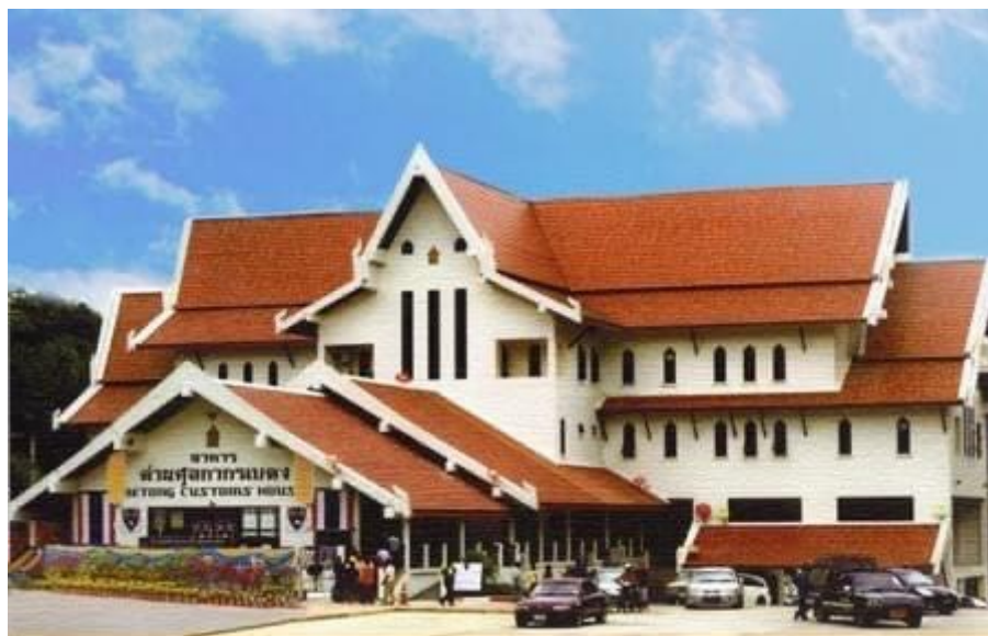
ภาพที่ ๒ ด้านศุลกากรเบตง

ด้านศุลกากรเบตงเป็นด้านศุลกากรทางบก สังกัดสำนักงานศุลกากรภาคที่ ๔ กรมศุลกากร กระทรวงการคลัง ตั้งอยู่ที่อำเภอเบตง จังหวัดยะลาเป็นด้านศุลกากรที่ตั้งอยู่ตอนใต้สุดของประเทศไทย มีพื้นที่ติดต่อกับอำเภอเป็งกาลัยฮูลู รัฐเปรัก ประเทศมาเลเซีย ประชาชนของทั้ง ๒ ประเทศไปมาติดต่อค้าขายกันโดยตลอด ใช้ภาษามลายูและภาษาจีนเป็นภาษาท้องถิ่น มีการนับถือศาสนาและความแตกต่างทางวัฒนธรรมที่หลากหลายในพื้นที่