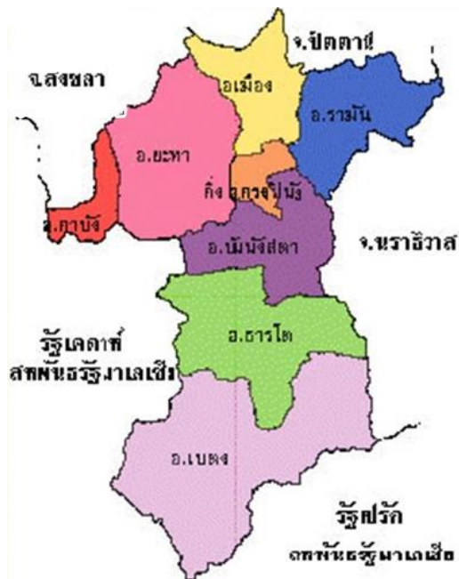
ภาพที่ ๓ แผนที่ขอบเขตพื้นที่ความรับผิดชอบของด่านศุลกากรเบตง โดย ทิศเหนือ ติดจังหวัดสงขลาและปัตตานี ทิศตะวันตก ติดรัฐเคดาห์ ประเทศมาเลเซีย ทิศตะวันออก ติดจังหวัดนราธิวาส ทิศใต้ ติดรัฐเปรัก ประเทศมาเลเซีย